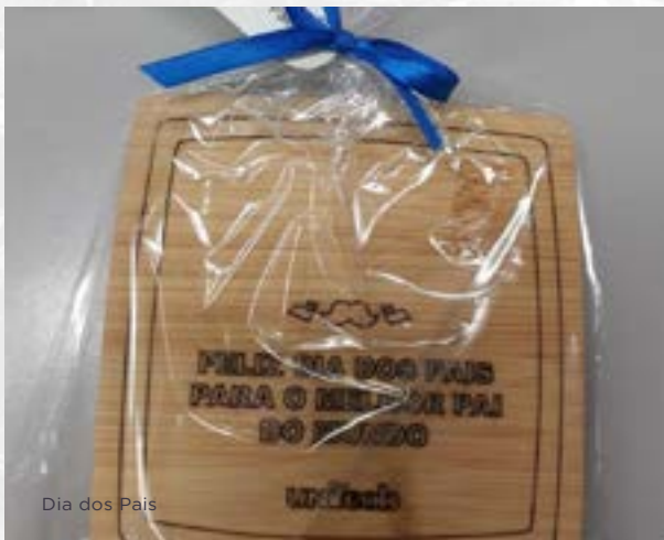
Dia dos Pais