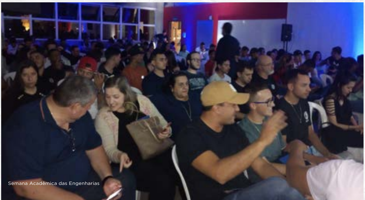
Semana Acadêmica das Engenharias