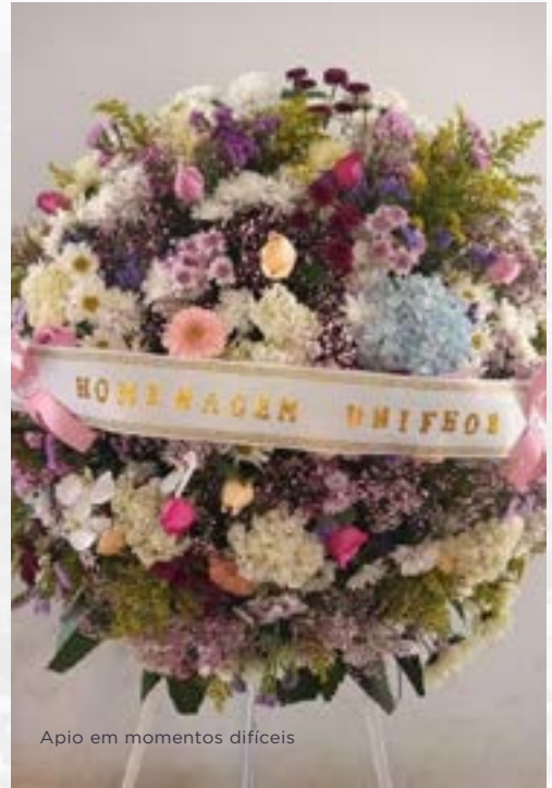
Apio em momentos difíceis