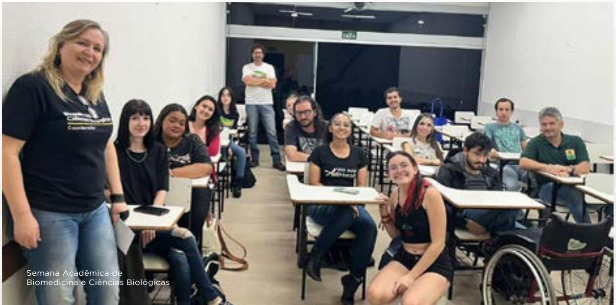
Semana Acadêmica de Biomedicina e Ciências Biológicas