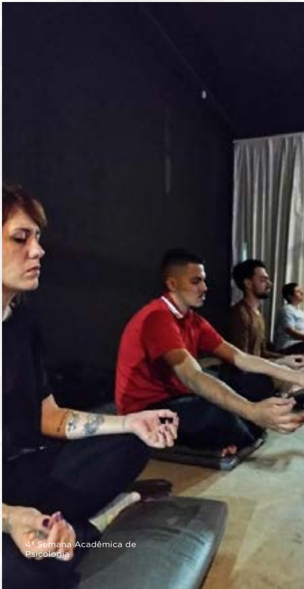
4ª Semana Acadêmica de Psicologia