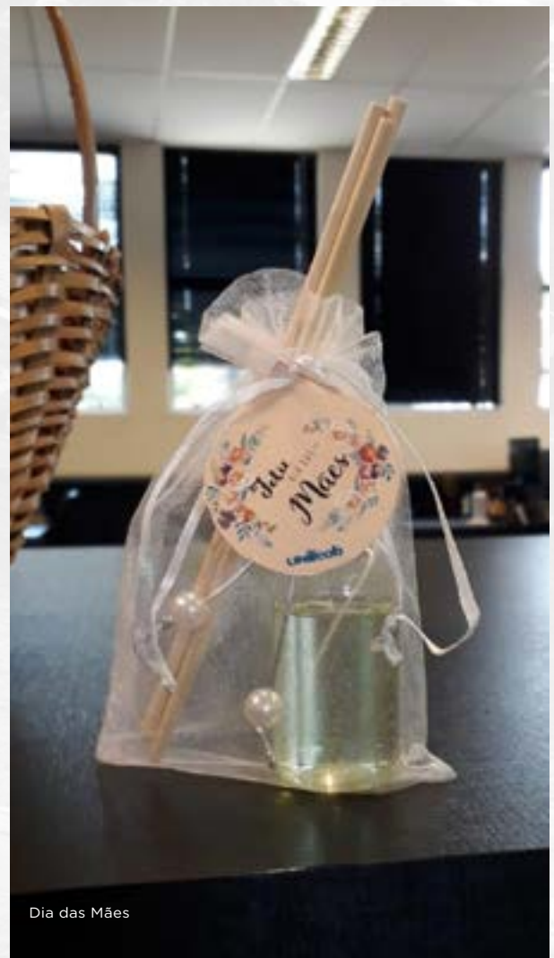
Dia das Mães