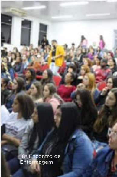
18º Encontro de Enfermagem