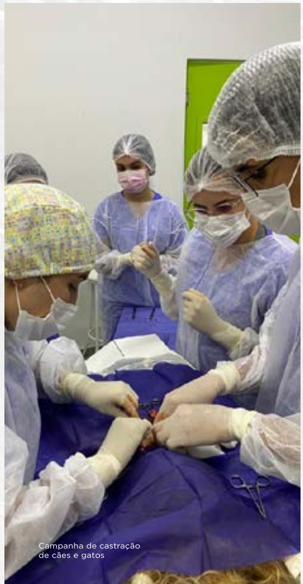
Campanha de castração de cães e gatos