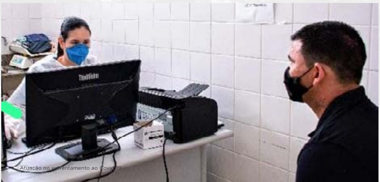
Atuação no enfrentamento ao Covid-19