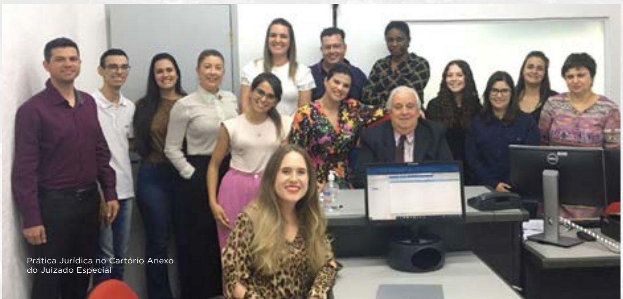
Prática Jurídica no Cartório Anexo do Juizado Especial