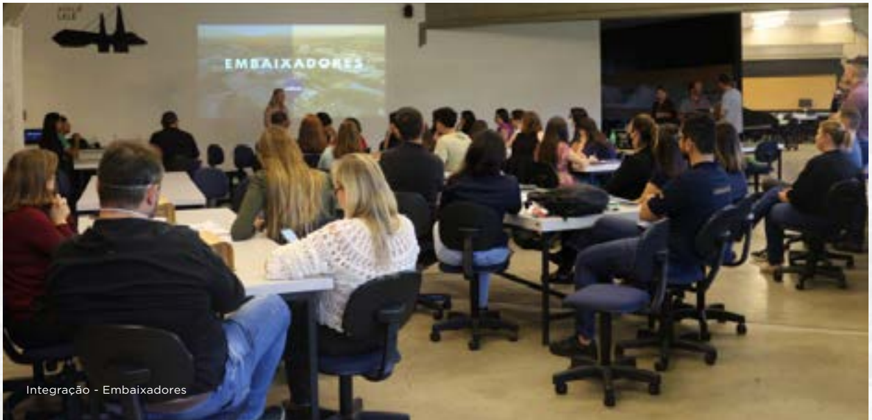
Integração - Embaixadores