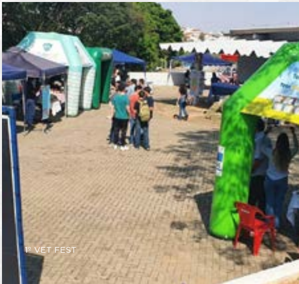
1º VET FEST