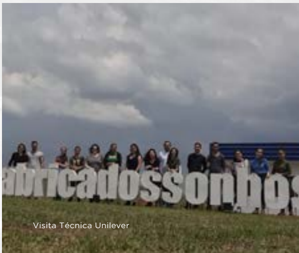
Visita Técnica Unilever