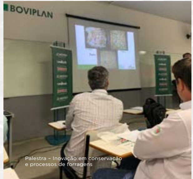
Palestra - Inovação em conservação e processos de forragens