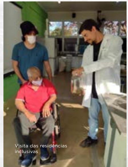
Visita das residências inclusivas