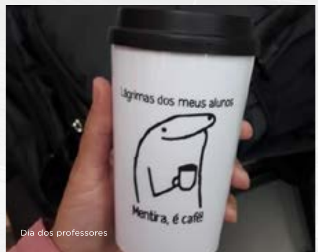
Dia dos professores