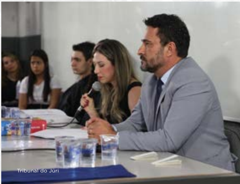
Tribunal do Júri