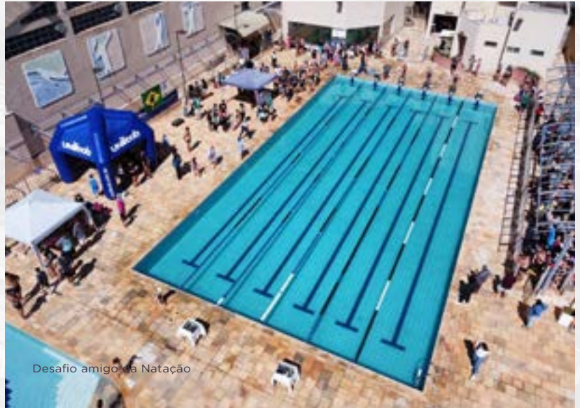
Desafio amigo da Natação