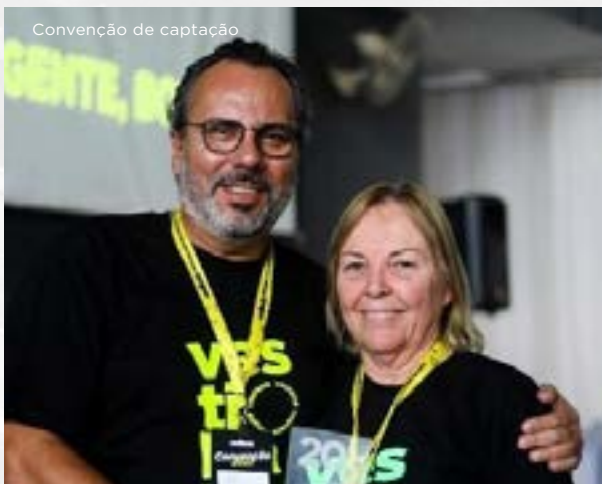
Convenção de captação