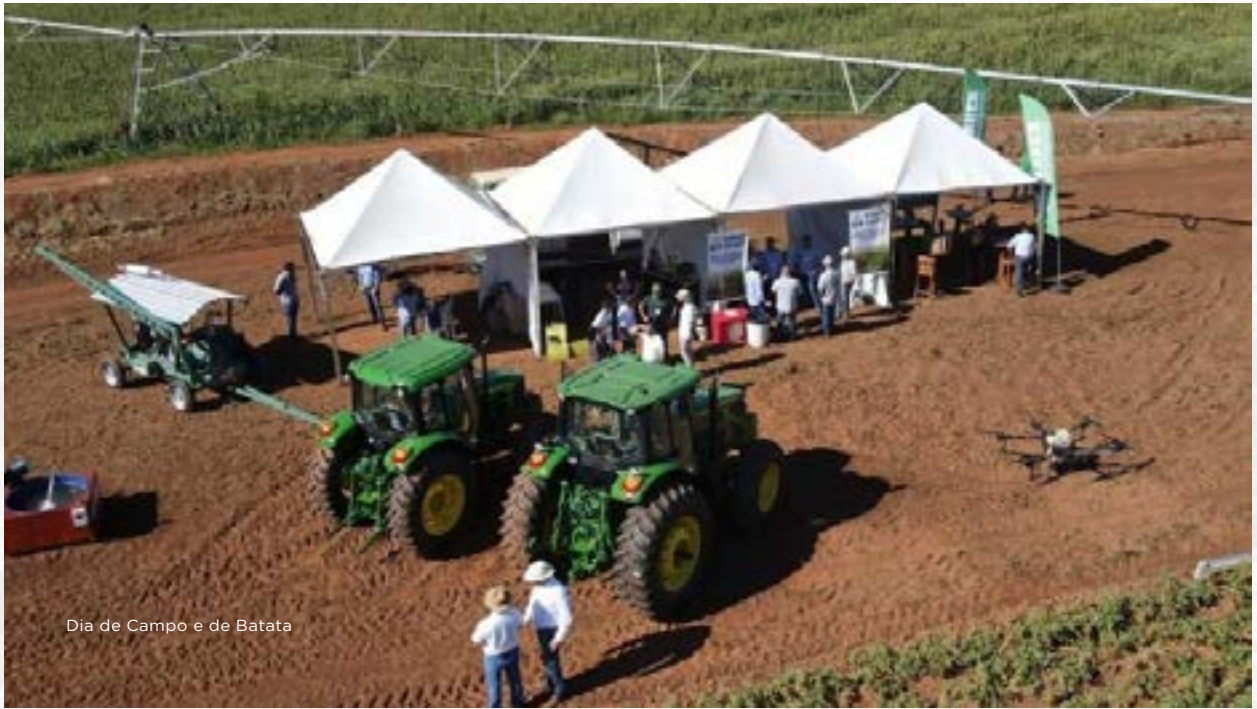
Dia de Campo e de Batata