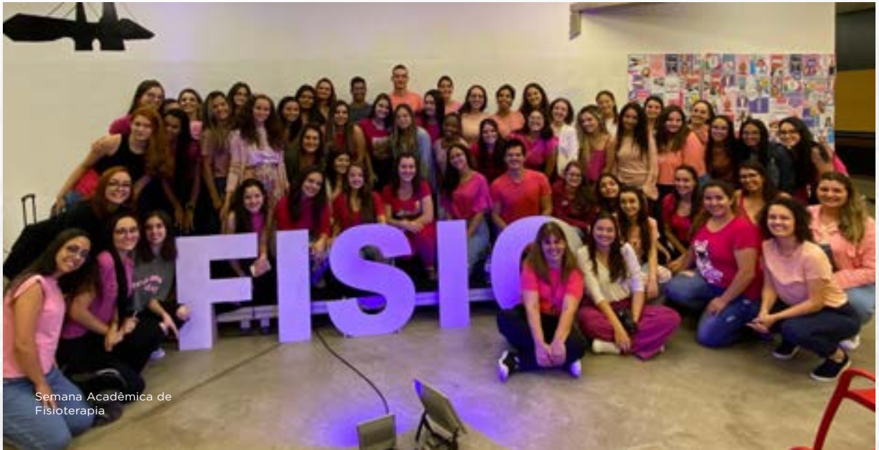
Semana Acadêmica de Fisioterapia