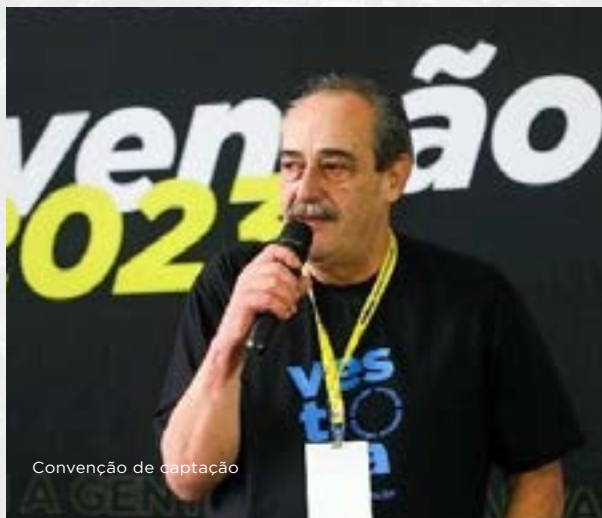
Convenção de captação