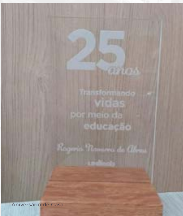
Aniversário de Casa