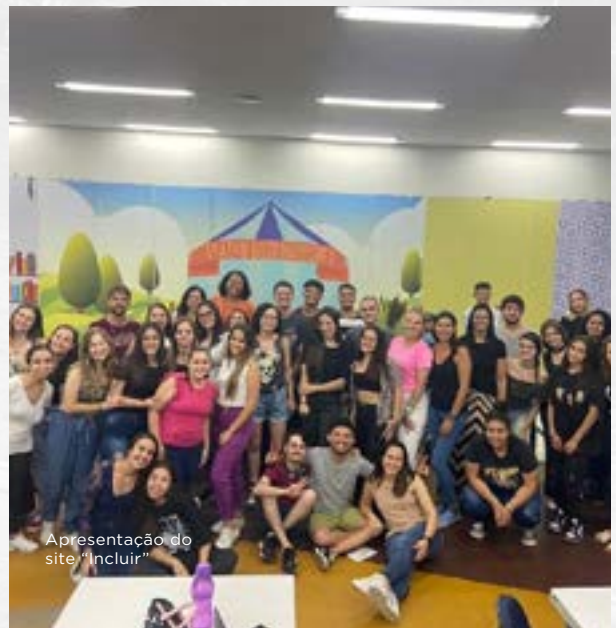
Apresentação do site "Incluir"