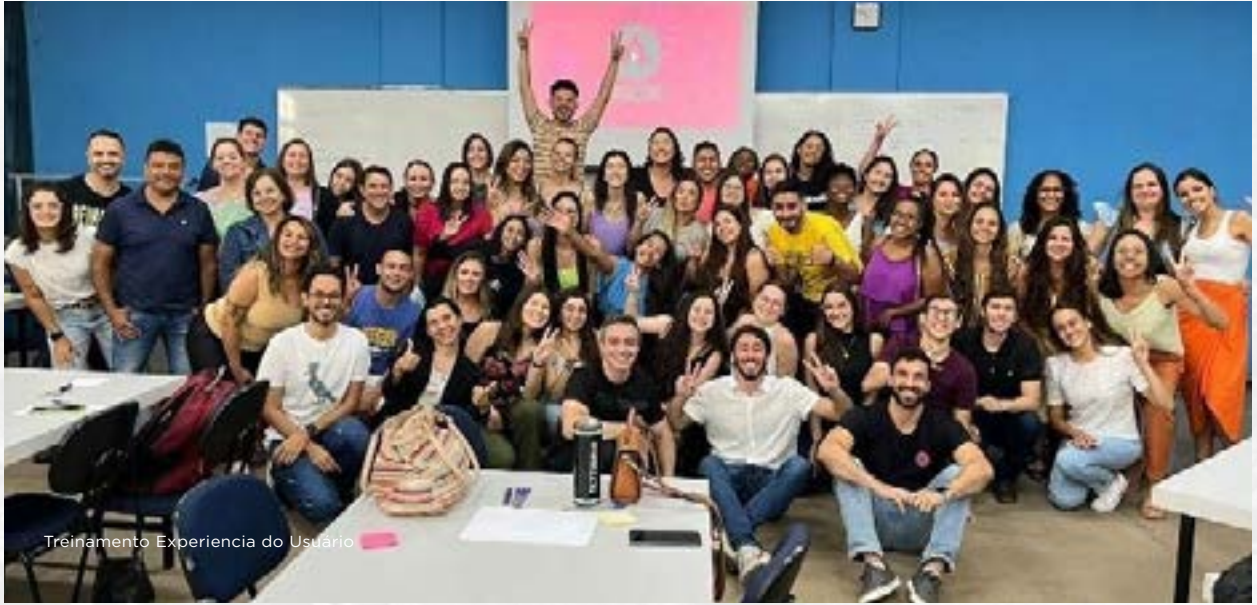
Treinamento Experiência do Usuário