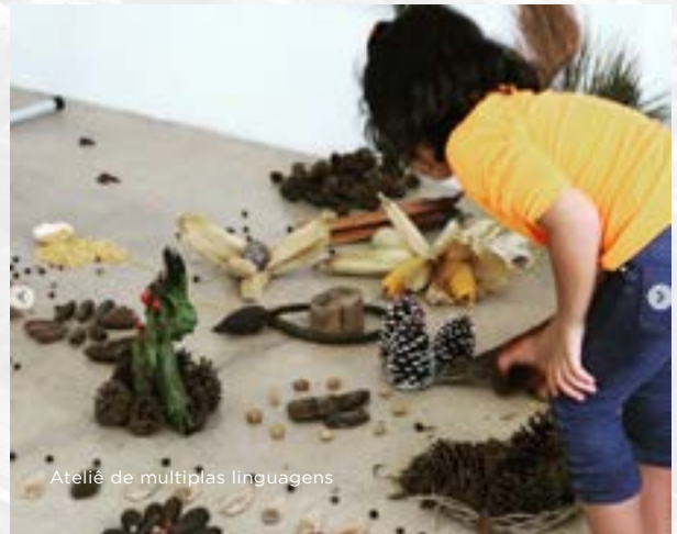
Ateliê de múltiplas linguagens