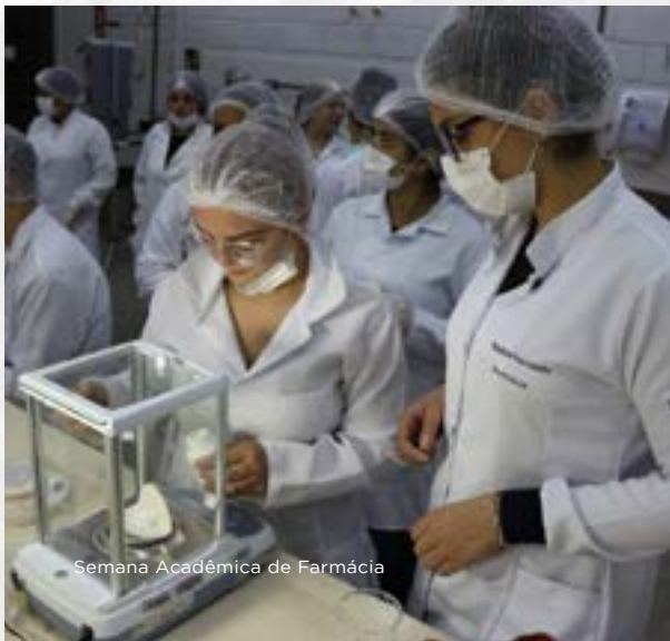
Semana Acadêmica de Farmácia